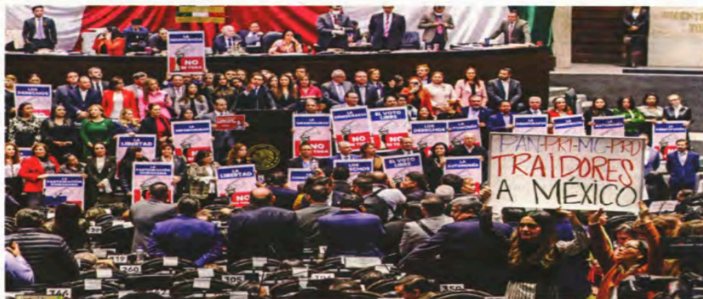
Diputados panistas llevaron pancartas de apoyo al INE, mientras que morenistas respondieron con carteles que los tachaban de traidores al país.