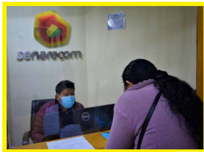
Trámite en ventanilla NIM

Nota: El Formulario SENARECOM M-01 y el formato establecido de carta se encuentra disponible para el llenado en la siguiente dirección: www.senarecom.gob.bo (Servicios).